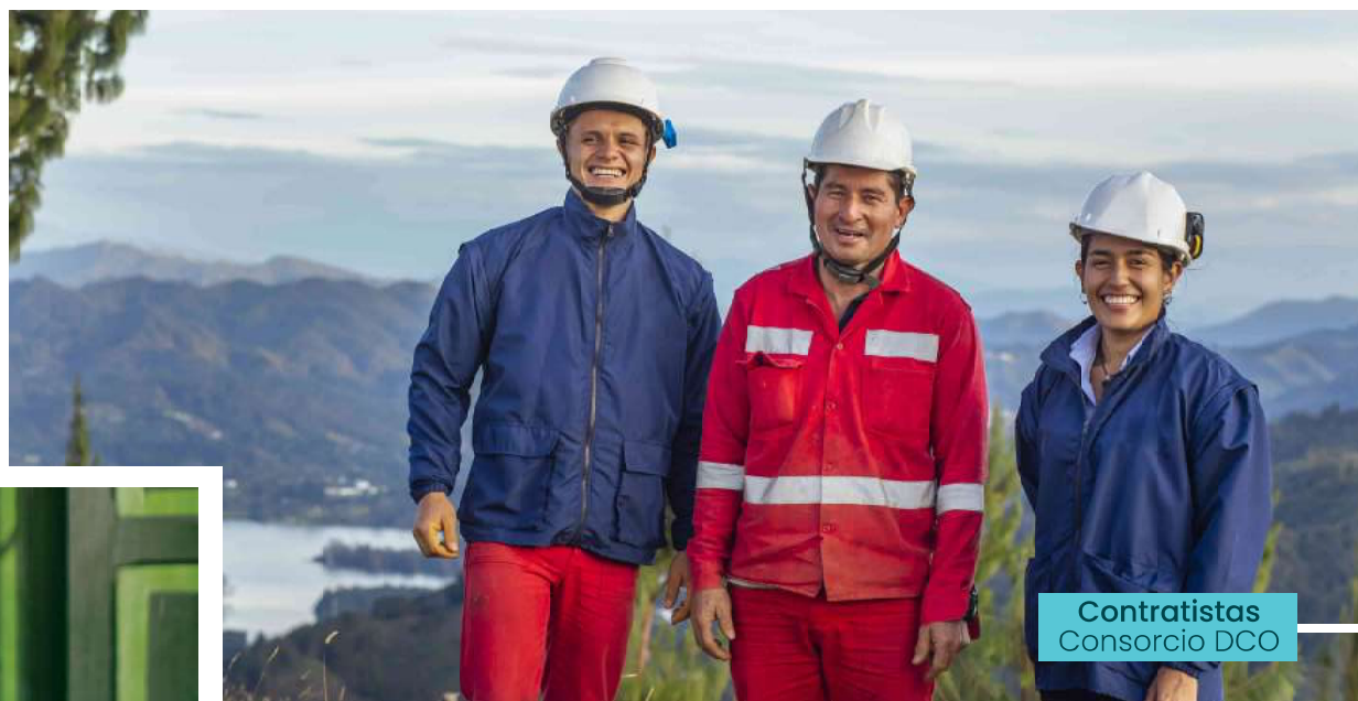
Contratistas Consortio DCO

Finalizado el año 2021, la Concesión culminó sin ninguna situación que cuestione la ética de sus colaboradores, así como, tampoco se presentaron quejas o denuncias en contra de personas destinadas a la ejecución del Proyecto que atenten contra las políticas de ética corporativa de la Concesión.