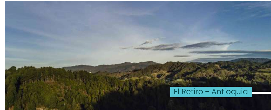
El Retiro - Antioquia